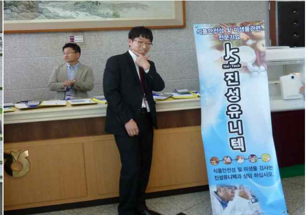
오빠 강남스타일!! 🎵