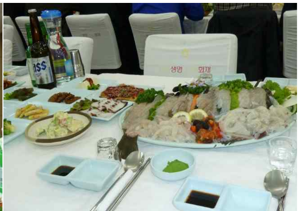
속초의 자연산 회!! ❤️❤️ (참석 못하신 분께는 죄송~ ㅠㅠ&)