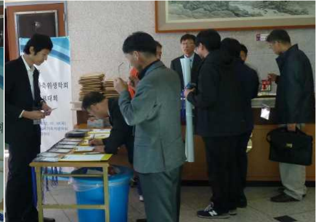
흔적 남기기는 필수!! (학술정보도 얻고, 상시학습 인정도 받고)