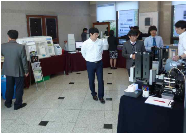
자투리 시간까지 최신장비 정보수집!