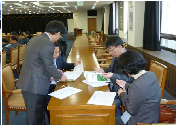
엄정한 심사 후 집계를 위한 격리(?) 조치!