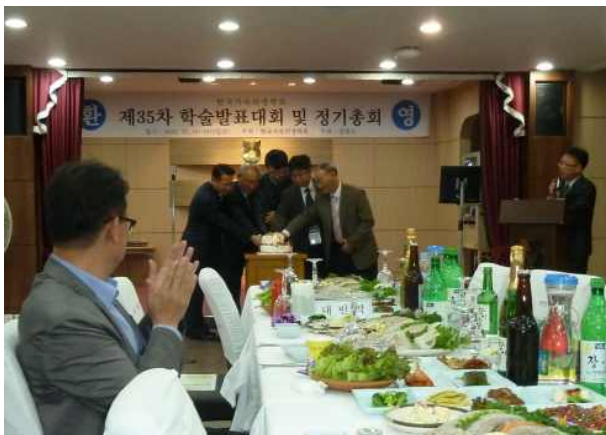
만찬에 앞서 케익 커팅으로 분위기 업!