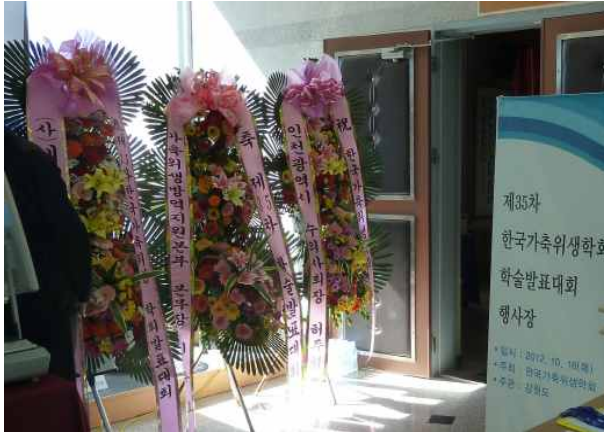
화려한 화환에 잔치집 분위기 🎵