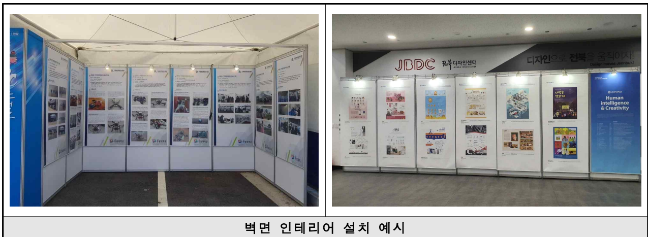
벽면 인테리어 설치 예시